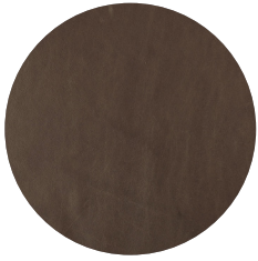
009 CAFFE TOSTATO